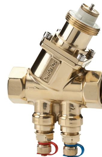
DN15 100 til 575 l/h