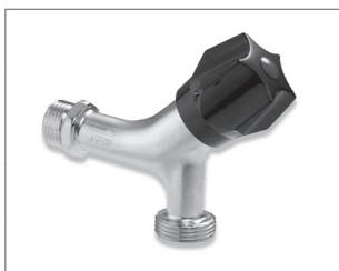
Aftapventil med kontra til vaske/opvaskemaskine