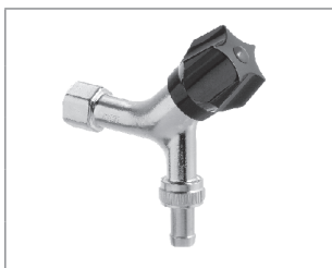
Aftapventil med muffe, kontra og slangeforskruning