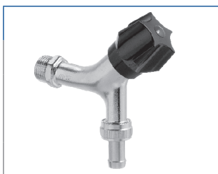
Aftapventil med nippel og slangeforskruning u/kontra