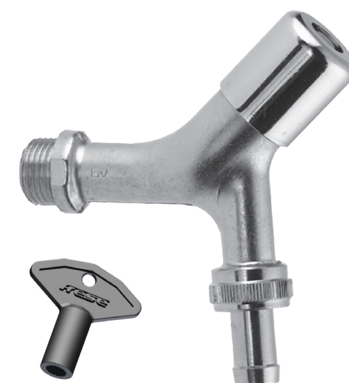
Frese nøgle til aftap