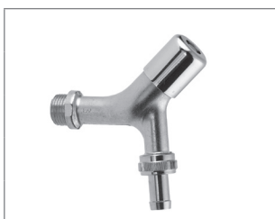
Aftapventil m/nippel, kontra og slangeforskruning t. nøgle