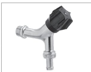
Aftapventil med nippel, kontra og slangeforskruning